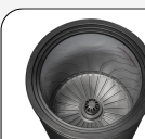
Ventilateur d'assistance interne