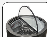
Couvercle supérieur en verre trempé